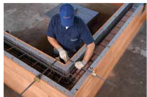
POROTON®-DS vario als Ringbalken